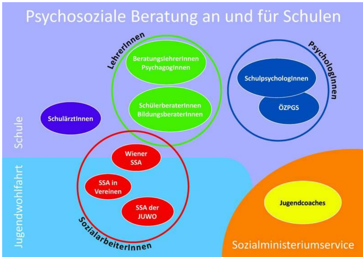
Abbildung 5-1: „Psychosoziale Beratung an und für Schulen“ http://www.schulpsychologie.at/schulpsychologiebrbildungsbildungsberatung/psychosoziale-beratung

Abbildung 5.1 ist eine grafische Darstellung der derzeitigen Unterstützungssysteme in, für und um die Schule. Diese Übersichtsgrafik ist der Homepage der Schulpsychologie entnommen. Im Rahmen der Interviews wurde diese auch den ExpertInnen der Unterstützungssysteme vorgelegt und deren Meinung bezüglich Gestaltung und möglichen Änderungsvorschlägen erhoben.