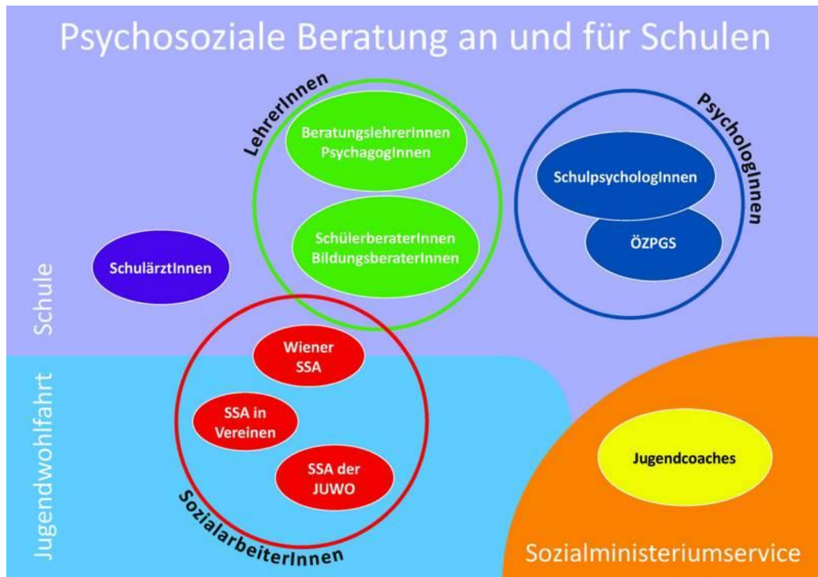
Abbildung 3-1: „Psychosoziale Beratung an und für Schulen“ (auf: http://www.schulpsychologie.at/schulpsychologiebrbildungsbildungsberatung/psychosoziale-beratung/ )

Einen kurzen, prägnanten Überblick über die derzeit im österreichischen Schulsystem vorhandenen psychosozialen Unterstützungssysteme in, für und um die Schule bietet folgende Grafik 5 :